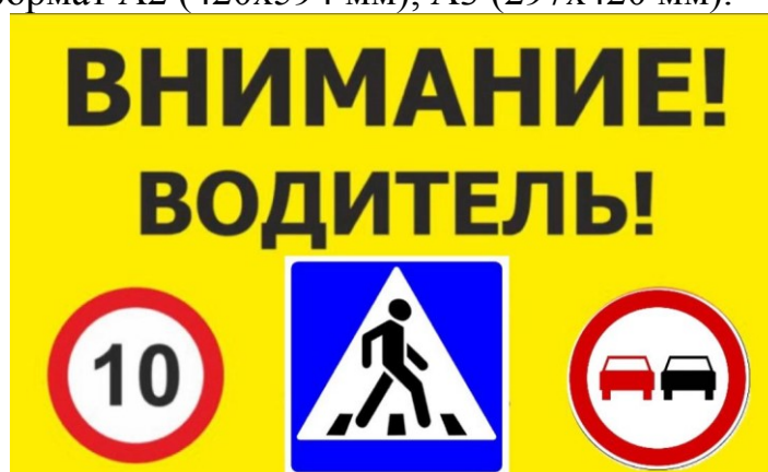
(рис.2 пример оформления плаката)

Экипировка и реквизиты участников акции: световозвращающий жилет, плакаты (рисунки 3, 4). Плакаты изготавливаются из листа плотной бумаги или картона с цветной печатью или рисунком на лицевой стороне. Рекомендуемый размер плаката: формат А2 (420х594 мм), А3 (297х420 мм).