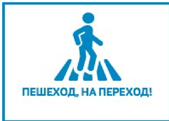
(рис.2 пример оформления плаката)